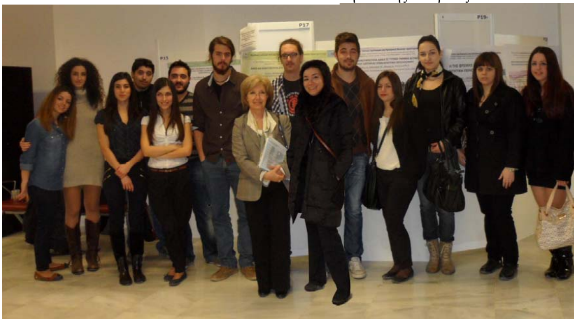
Ομαδική φωτογραφία των φοιτητών του ΤΜΧΑ με το προεδρείο της συνεδρίας.

Επικεντρώθηκε σε θέματα ένταξης φυσικής δραστηριότητας των ΑΜΕΑ στο δημόσιο χώρο, όπως διαμορφώθηκαν από σχετικά ερωτηματολόγια στα οποία απάντησαν πολίτες της Θεσσαλονίκης και αφορούσαν στην αποτίμηση των παρεμβάσεων του Δήμου σε δυο δρόμους του ιστορικού κέντρου της πόλης, τη Χρυσοστόμου Σμύρνης και τη Φιλικής Εταιρείας.